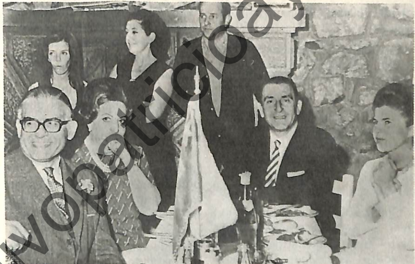
Eduardo Frei, el 27 de junio de 1947: "Rechazamos la doctrina y la táctica comunista, pero ante el comunismo vemos que hay algo peor: el anticomunismo"

nera en la forma en que lo hace la empresa capitalista. Los demócratacristianos tratan de ligar forzosamente a las personas a la empresa en la cual trabajan, en carácter de copropietarios y cogestores de ella. A mi juicio, hay ahí una mala percepción de lo que es la vocación empresarial. En efecto, así como hay seres humanos que vienen dotados por Dios en forma superior a otros para la tarea de filosofar, otros para la de pintar, otros para la de escribir, otros para