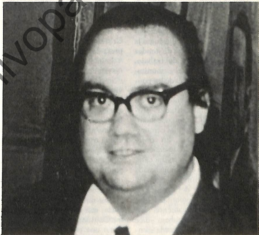
Claudio Orrego fue tal vez uno de los dos ideólogos principales del pensamiento demócrata cristiano.