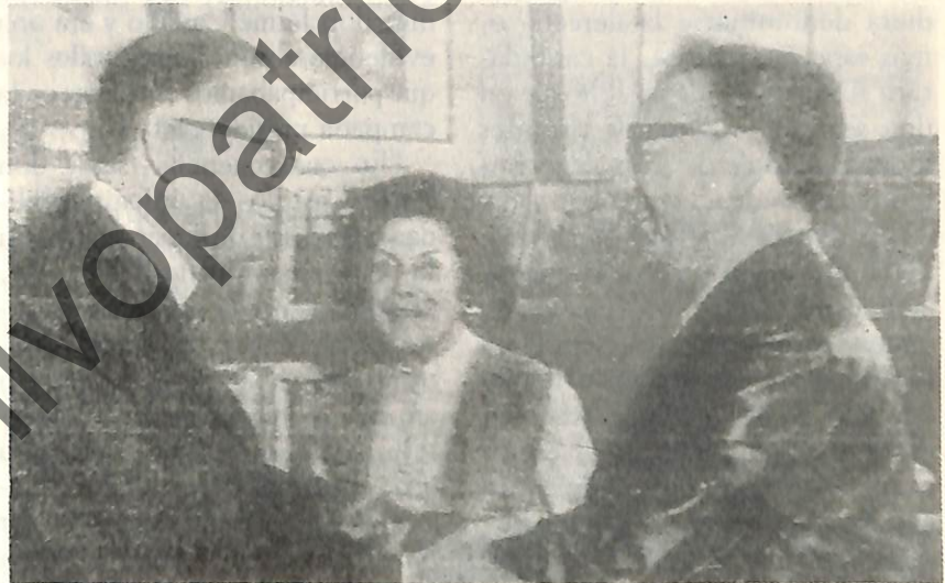
La afinidad tomicista-allendista se percibía en la campaña presidencial de 1970. La noche de la victoria de Salvador Allende se abrazaron juntos.

hemos visto que mientras no trepida en hablar de anticapitalismo, rehúsa hablar de anticomunismo. Y hay un factor perfectamente explicable en este complejo. Ustedes saben la historia del surgimiento del Partido Demócrata Cristiano como una escisión primero del Partido Conservador, bajo el nombre de Falange Nacional, la que después se unió a otras facciones nuevamente desgajadas del mismo Partido Conservador y con algunos sectores agrariolaboristas para formar el Partido Demócrata Cristiano, que ya emerge a la vida política como tal el año 1957 y que con la candidatura presidencial de Frei el año 1958 se afianza definitivamente como una gran fuerza