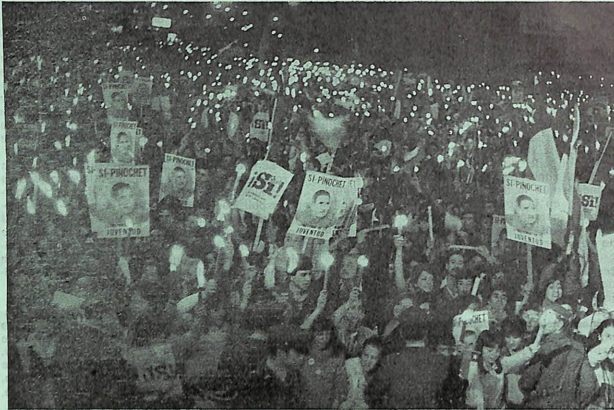
CELEBRACION DESPUES DEL SI

quier reforma constitucional, sea porque se exige formalmente (art. 118), sea por los altos quórum que el Congreso requerirá para insistir en un proyecto que el Presidente rechace (art. 117), según se explica en el Capítulo XIII de este informe;