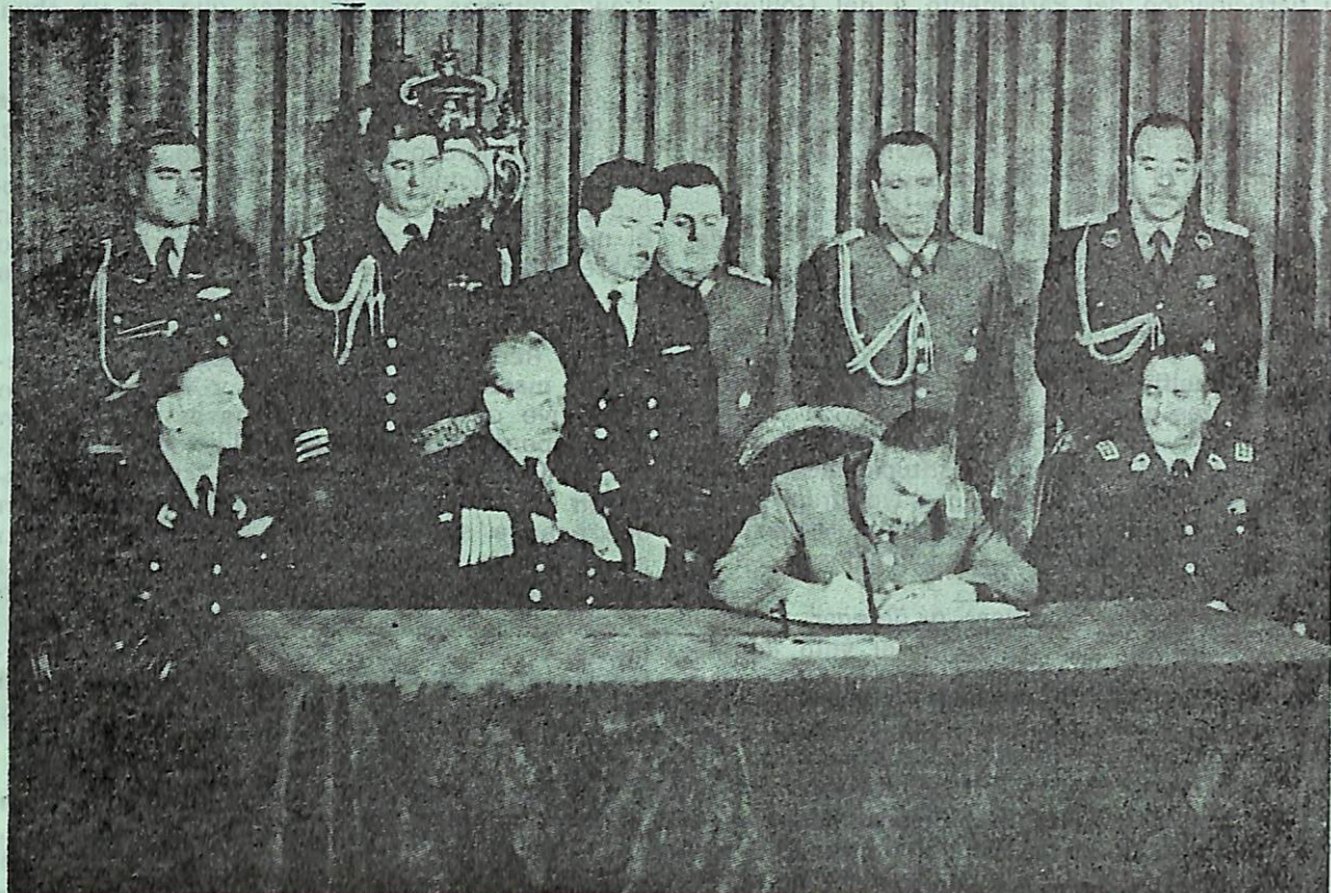
EL GENERAL PINOCHET, PROMULGA LA NUEVA CONSTITUCION

se otorga a los tribunales colegiados para designar funcionarios suplentes.