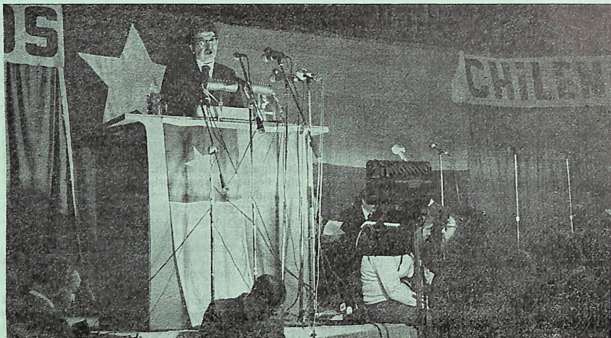
MANUEL SANHUEZA, PRESIDENTE DEL GRUPO DE LOS 24, EN EL CAUPOLICAN

der de establecer por sí mismo las normas de su funcionamiento, de autoconvocarse a legislaturas extraordinarias, de formar su propia tabla de trabajo y calificar las urgencias, de pronunciarse con cierta libertad sobre el Presupuesto de la Nación y, sobre todo, de calificar las circunstancias de emergencia que justifiquen la limitación o restricción de las libertades públicas y algunos derechos individuales por determinados períodos.