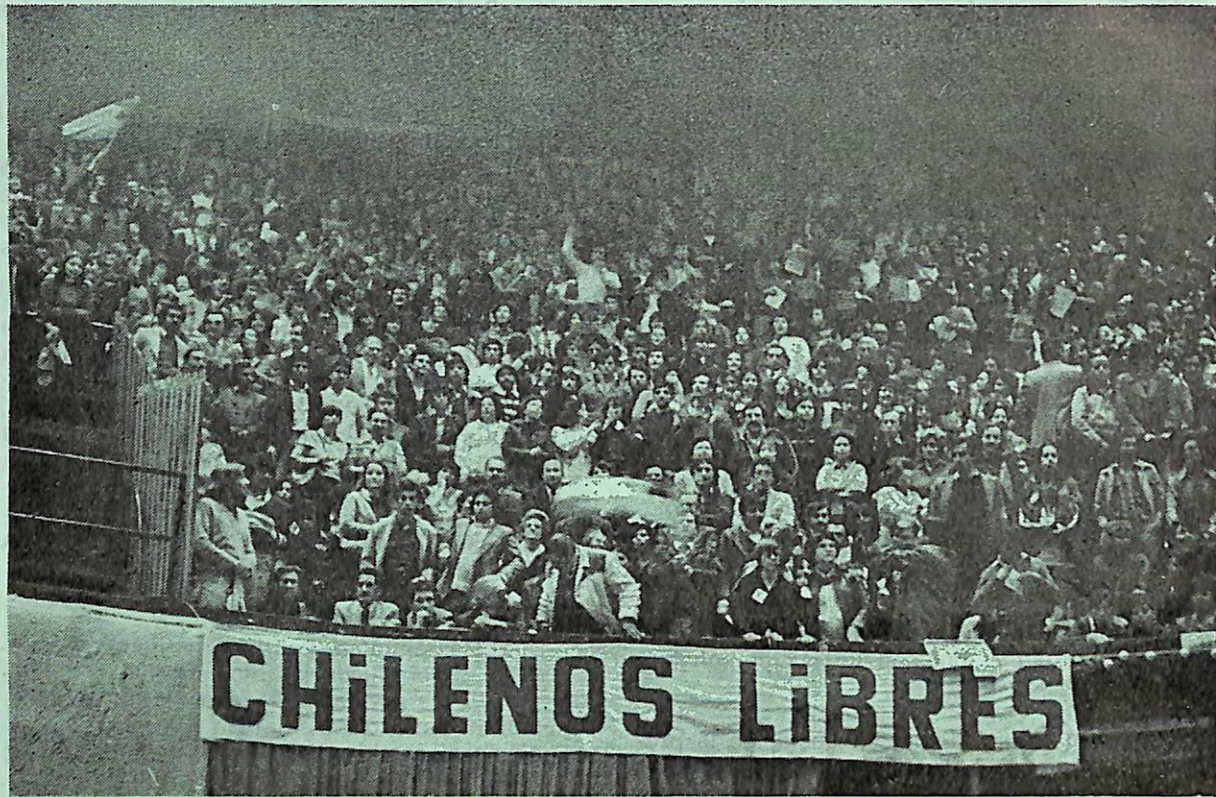
LOS QUE QUERIAN EL NO

d) El menosprecio total de las organizaciones sociales como factores activos de la vida económica . No se contempla la existencia de ningún organismo de participación, ni a nivel macro-económico, como podría ser un Consejo Económico-Social, ni a nivel de las empresas.