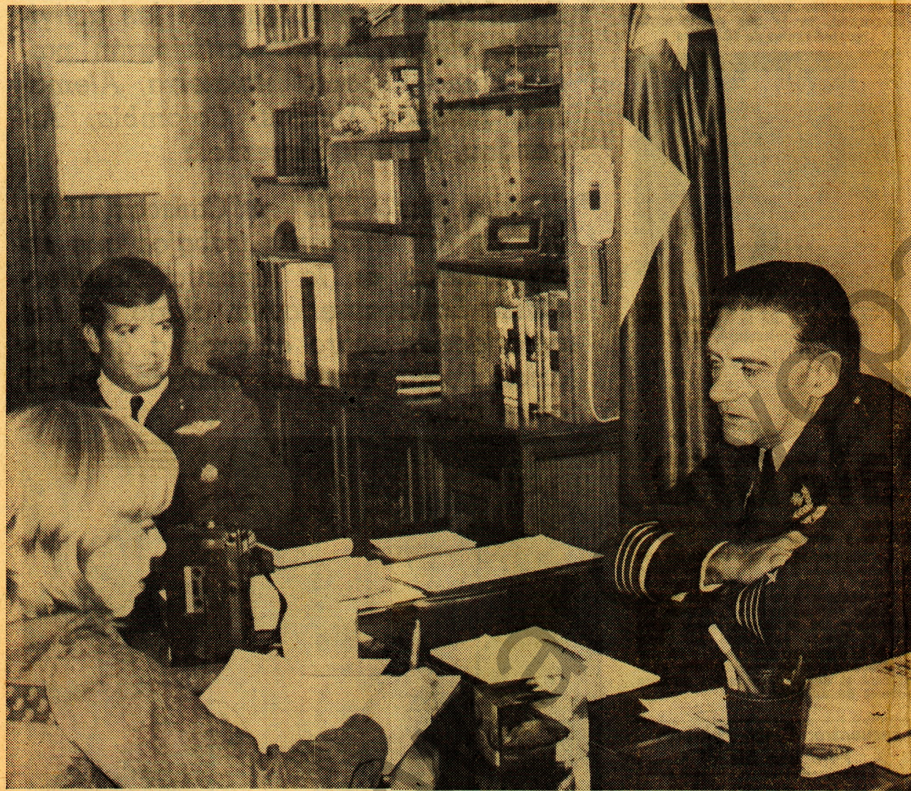
Un año del general Matthei como miembro de la Junta: "Hemos trabajado en leyes que tienden a dar verdadera libertad a los chilenos"

—¿Y cuándo debieran estar entonces funcionando las corrientes políticas libremente?