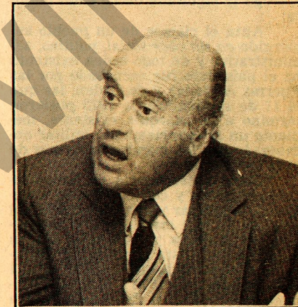
"El país no entiende que quienes se han comprometido a través del Acuerdo a no pactar con el PC tomen después actitudes contradictorias".

El dirigente político señala que el Partido Nacional tiene una posición muy clara y categórica respecto a si los firmantes del Acuerdo pueden o no aliarse electoralmente con el comunismo.