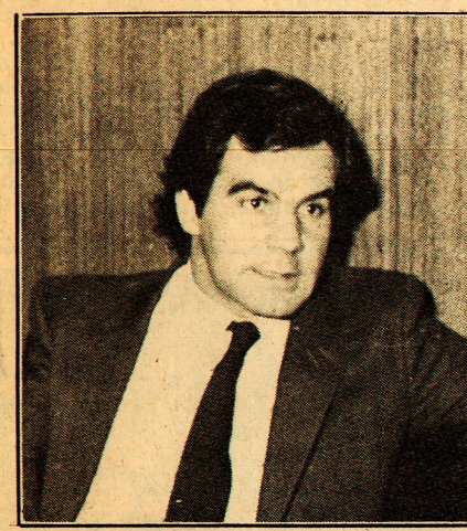
"Es inaceptable invocar la autonomía de las organizaciones intermedias respecto al Acuerdo Nacional, cuando las elecciones al interior de las mismas tienen un marcado contenido político".

PARA el joven dirigente de la Unión Nacional, tanto las alianzas electorales, como las formas de movilización social y la autonomía de las organizaciones intermedias plantean problemas que requieren precisiones, las cuales él parece tener muy claras.