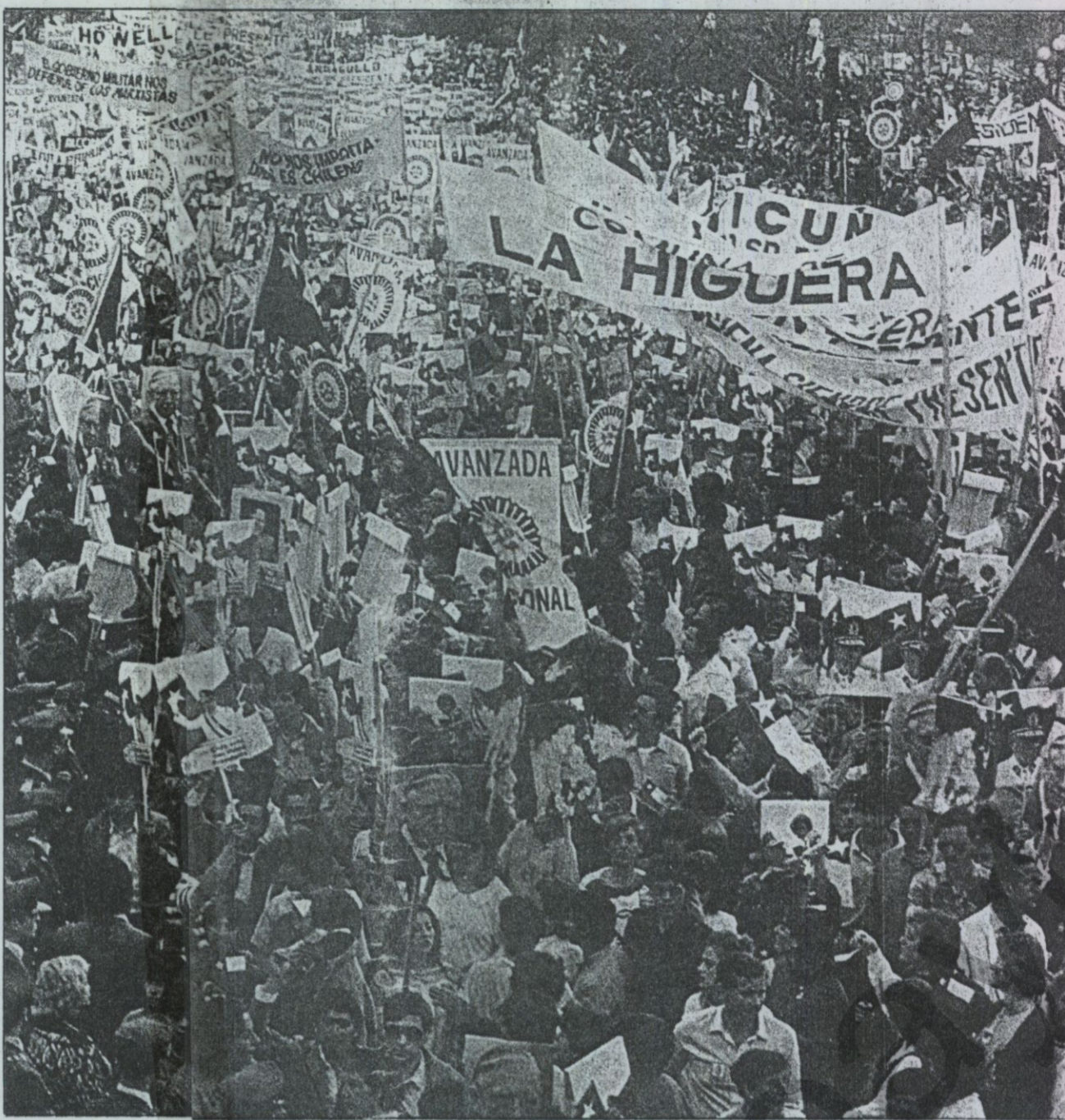
EXPRESIVA Y MASIVA ADHESION AL GOBIERNO. — Una parte de los asistentes al multitudinario desfile que se realizó ayer ante el Presidente Augusto Pinochet, la Primera Dama de la Nación, la Junta de Gobierno y los Ministros de Estado. En la entusiasta manifestación de apoyo al Gobierno participaron delegaciones de jóvenes, trabajadores, estudiantes, dirigentes gremiales, damas del voluntariado, huasos, y pobladores en general de Santiago y regiones, entre numerosas otras columnas de adherentes que marcharon durante varias horas desbordando la avenida Bernardo O'Higgins desde el Altar de la Patria.