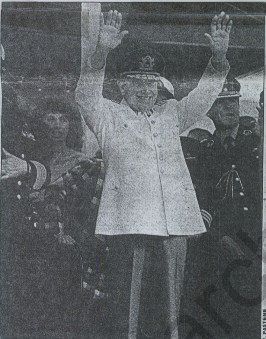
ALEGRIA PRESIDENCIAL. — Con sus brazos en alto, el Presidente Augusto Pinochet saludó todas las expresiones de apoyo que recibió de parte de las miles de personas que, durante toda la tarde y hasta entrada la noche, desfilaron en la manifestación que se realizó en la Avenida Libertador Bernardo O'Higgins de la capital.