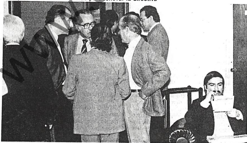
El espíritu electoral: seis días para renovar la directiva