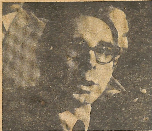
EL SECRETARIO GENERAL DEL PS, senador Altamirano acusó al presidente del PDC, senador Irureta, de ser hipócrita e ilógico, por no decir nada concreto sobre la venta de cobre.

El asunto se inició por un comentario insidioso que hizo el diputado del PN a la salida del hemicycleo del Senado.