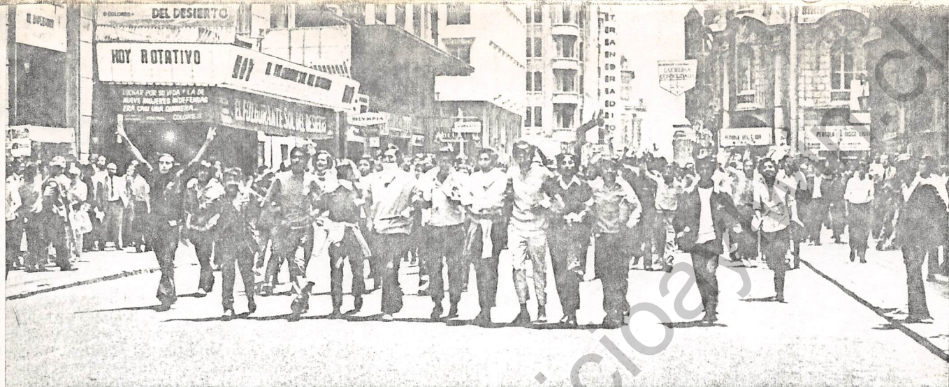
INCIDENTES EN EL CENTRO DE SANTIAGO: JUVENTUDES SE DIVIDEN Avanzan unos, otros retroceden, mientras caen las bombas lacrimógenas y las piedras