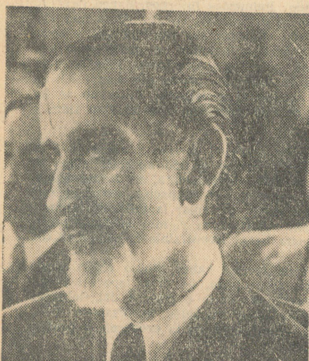
Ministro de Defensa, José Tohá