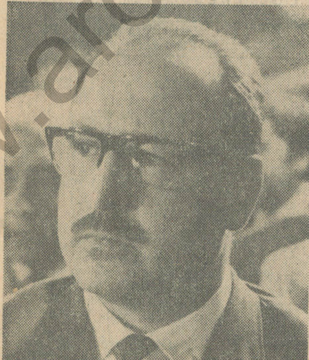
Ministro de Minería, Mauricio Jungk