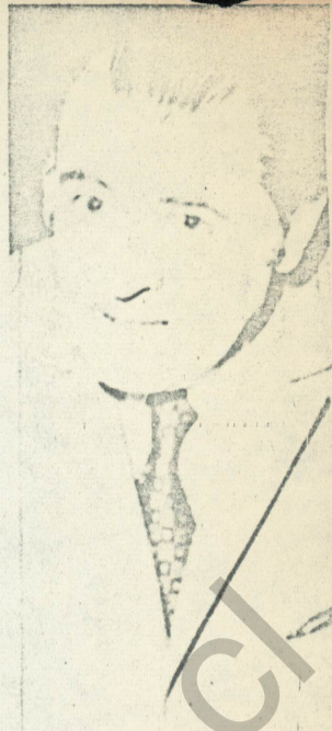
Patricio Aylwin, Presidente del Senado, quien no tuvo vergüenza en proclamar a Sergio Diez en la plaza de Linares.

—Incapaz de reunir gente en torno a su postulación candidato de la derecha recurrió a la burda triquiñuela de presentar su concentración final como una reunión gremial, engañando a campesinos y trabajadores.—