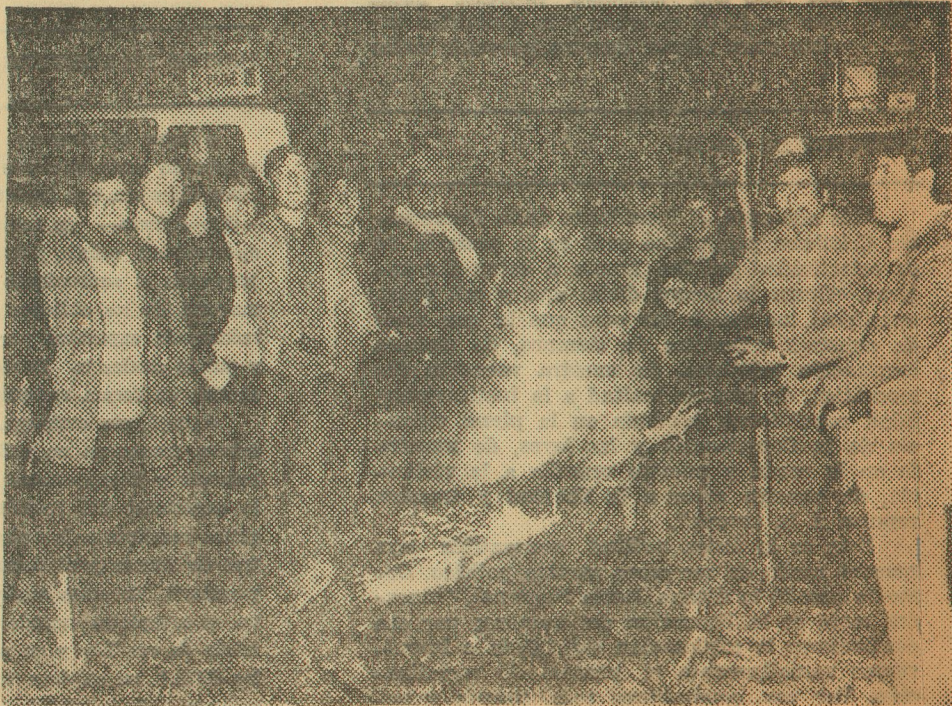
En el campamento levantado en el Fundo "El Peñón" por los choferes de camiones, el frío reinante en el desamparado lugar se combate encendiendo fogatas para pasar el helado clima. El optimismo reflejado en sus rostros se debe a la acogida unánime que encontró el paro entre las bases del gremio.

campamento permanecen en estado de alerta, por las posibles represalias que pudieran tomar en contra de ellos los extremistas de izquierda, se piensa que durante el día de hoy dejen de circular en su totalidad los camiones que aún quedan en servicio.