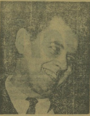
PATRICIO AYLWIN: Camino propio.

Una de las más importantes y quizás decisiva reunión para su futuro político comienza hoy en el Partido Demócrata Cristiano. La Junta Nacional del Partido de Gobierno, que se inicia a las 9.30 horas de hoy, con la asistencia de alrededor de 500 delegados no tendrá ya, como en otras ocasiones, la trascendencia de analizar la obra del actual Gobierno, sino que más bien en ella, se proyectará el destino futuro del Partido que en 1964, con el triunfo del Presidente Frei, pasó a convertirse en la primera fuerza política del país. Se trata ahora, según las distintas corrientes en que se encuentra dividida desde hace tiempo la DC, de "definirse" en el espectro político del país con miras a la elección presidencial de 1970.