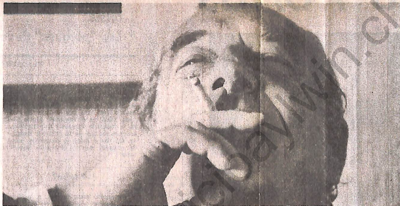
"Sería bueno que se empezara a pensar luego cómo se van a organizar los partidos políticos"

—Exactamente. Pero el problema está en qué nivel de bienestar y a qué costo. Aún en los tiempos que dieron pie al triunfalismo hubo una cesantía dos o tres veces mayor que la histórica. O sea, alguien pagó ese esfuerzo. La inversión neta fue bajísima —menos de la mitad de la histórica— y el resultado fue que, efectivamente, una gruesa masa de chilenos tuvo acceso a bienes; pero, como no se produjo la inversión, el país se quedará con chatarra, sin aumento de fuentes de trabajo, sin mejorar su capacidad industrial, sin una estructura modernizada. O sea, con un porvenir extremadamente riesgoso.