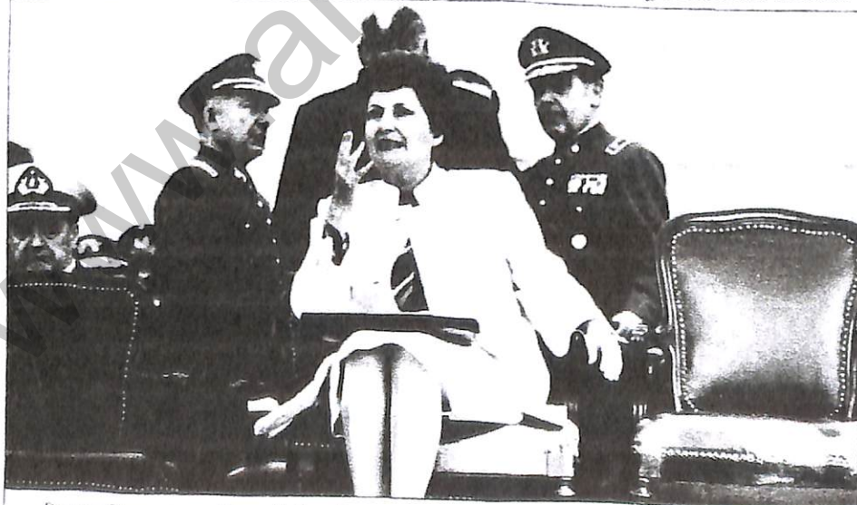
Primera Dama, Luisa Huidobro, en un momento de su discurso.

En el fondo la idea es preparar el gran Pliego de Chile que ya desde hace tiempo venía impulsando el Comando Nacional de Trabajadores y que ya tienen bastante adelantado las organizaciones sindicales, estudiantiles y poblacionales y algunos colegios profesionales. Por lo que supo ANALISIS se trataría de tener este gran pliego listo a mediados de abril, lo que implicará un urgente trabajo de concertación y movilización para las próximas