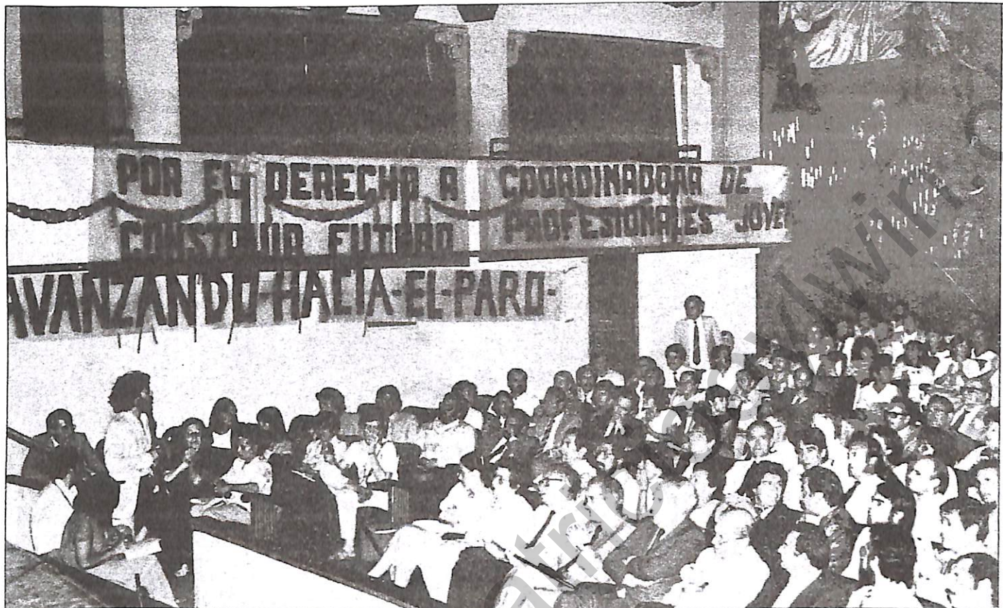
Ante los profesionales y dirigentes políticos, la Federación de Colegios llamó a los demás sectores sociales a concertarse en torno a la gran demanda nacional