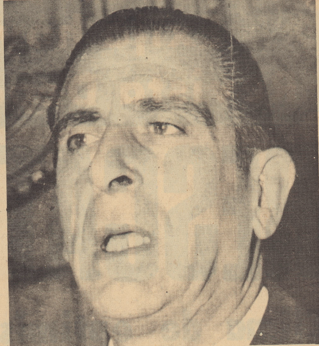
Presidente Frei: "Chile correspondiendo a la evolución del tiempo y a sus exigencias ha ido adquiriendo la propiedad de recursos fundamentales para la Nación en el futuro, y el control de los elementos básicos de su desarrollo".