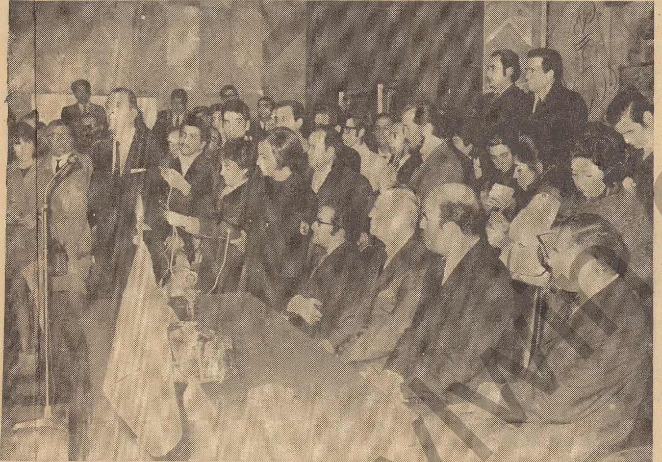
El Presidente de la República, Eduardo Frei, promulga la Ley en virtud de la cual la Corporación de Fomento de la Producción adquirirá las acciones que la South American Power tiene en la Compañía Chilena de Electricidad y que representa el 74,75 por ciento de las acciones.

El contrato de compraventa que celebre CORFO con la South American Power Company deberá ser aprobado por el Presidente de la República mediante Decreto Supremo publicado en el Diario Oficial. Por otra parte, la Ley de Nacionalización contempla en uno de sus artículos la transferencia, sin costo para la CORFO, de las acciones y valores emitidos por CHILECTRA que se encuentran en poder del Fisco.