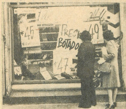
PRECIOS "BOTADOS"... ...en pesos ($)

● "A la Ville de Nice" exhibe todo con rebajas de un 20%. Y después de las 7 de la tarde, todavía abunda la gente mirando, comentando y estudiando las llamativas