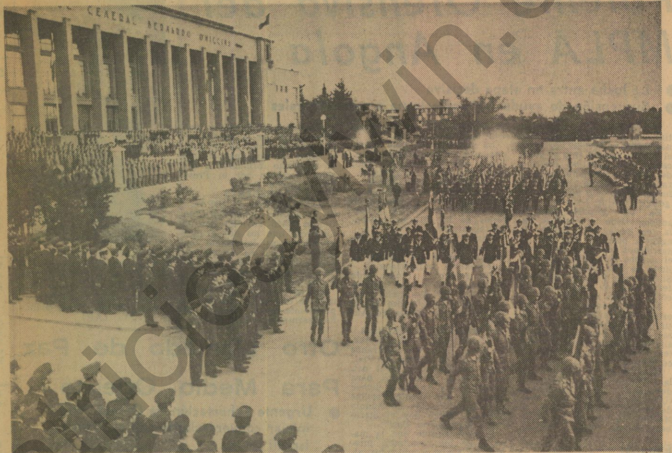
Una vez finalizada la intervención del Presidente Pinochet las agrupaciones de FF. AA. y Carabineros desfilaron ante S. E. e integrantes de la Junta de Gobierno.

no fueron capaces de conducir a Chile al destino feliz que se comprometieron en sus campañas electorales, sino que por el contrario, lo sumieron en el obscurantismo y en el caos del marxismo-leninismo, hoy en día se sienten redentores, y como sus llamados no tienen eco en el chileno honesto y de trabajo, han lanzado a la prensa extranjera sus diatribas para que desde el mundo entero se ataque a Chile y su Gobierno.