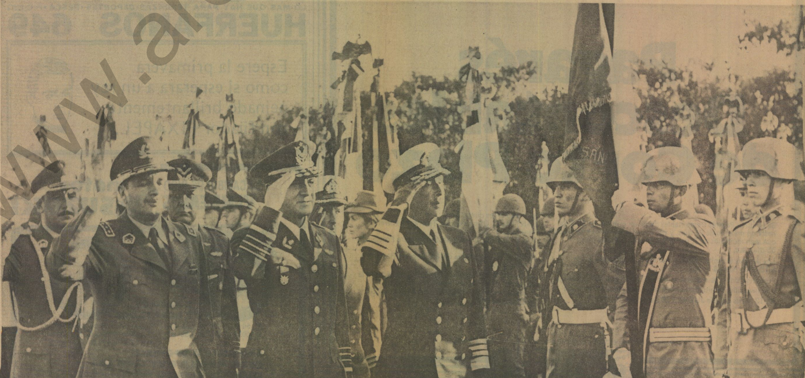
Los integrantes de la Junta de Gobierno, almirante José Toribio Merino; general del aire, Gustavo Leigh, y General Director de Carabineros, César Mendoza, revistan los 12 batallones del Ejército, Armada, Fuerza Aérea y Carabineros en el patio de honor de la Escuela Militar "Bernardo O'Higgins". En la solemne ceremonia que se realizó

Iniciada en el país una campaña de calumnias y sofismas, por ex dirigentes políticos (Continúa en la Pág. 10)